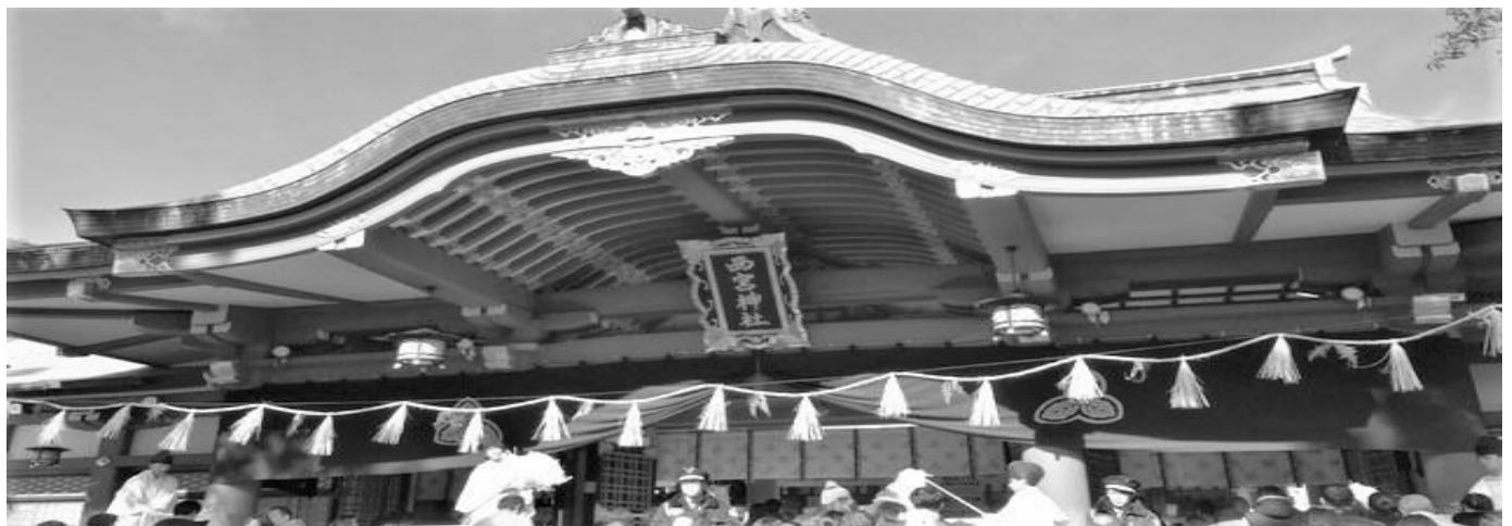
えびす宮総本社 西宮神社