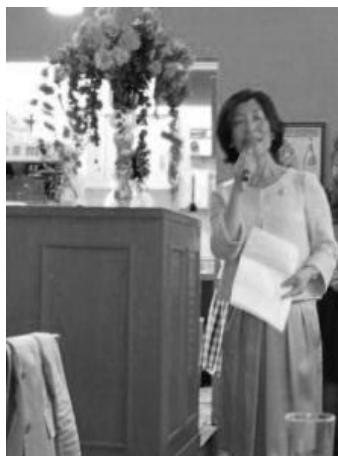
デモンストレーションで活けた 英国式アレンジメント→

大きな特色は、社員(会社における株主)には、出資の必要がないことです。社員からの会費や、基金の拠出によって運営していきます。議決権は、原則として一人一議決権で、利益を社員に還元するというところもありません。