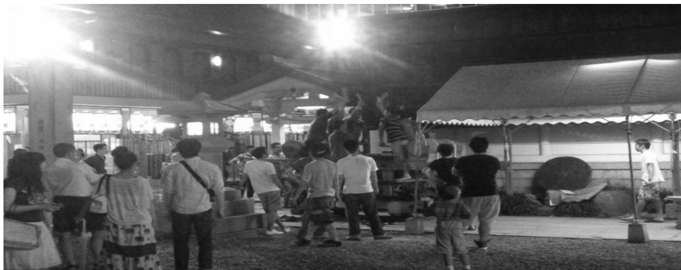
お初天神の役太鼓練習風景